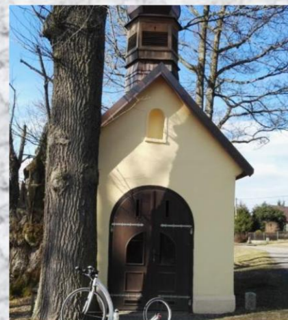
Branka / 20B